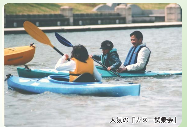
人気の「カヌー試乗会」