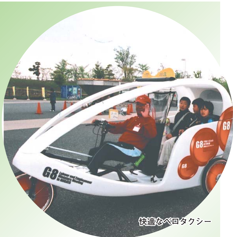
快適なベロタクシー