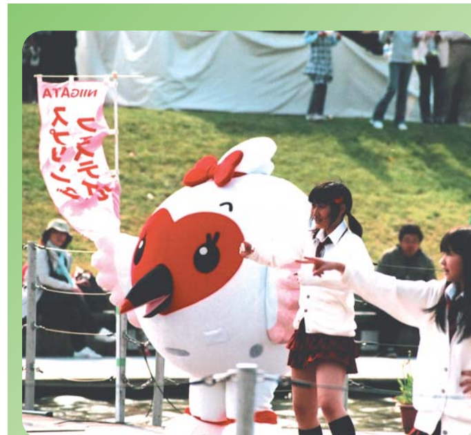
トッキキと踊ろう